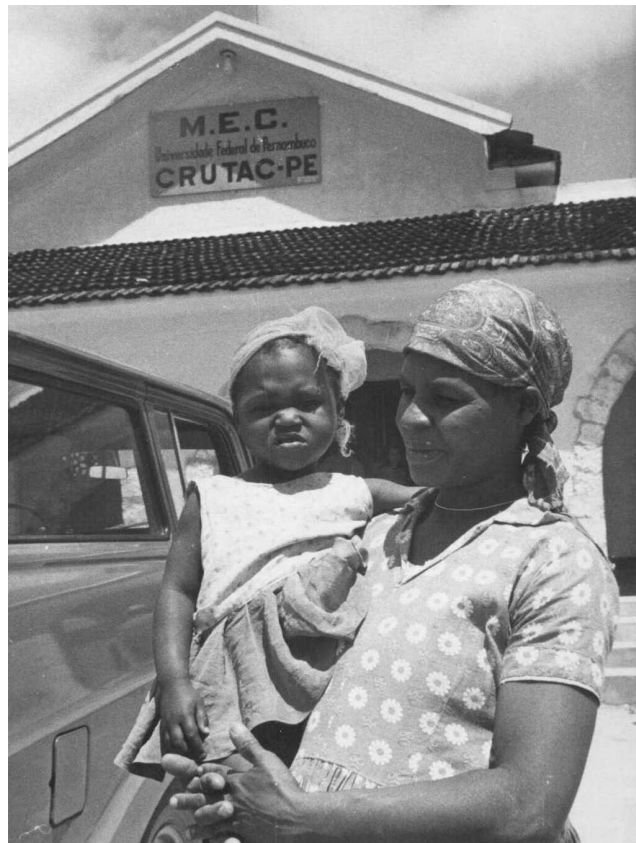
Fotografia 06 – Atendimento prestado pelo CRUTAC, município de Sairé - PE, década de 1970.