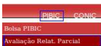
Figura 3 – Avaliação Relatório Parcial

Obs.: O perfil onde se encontra o menu PIBIC é o Perfil Pesquisa.