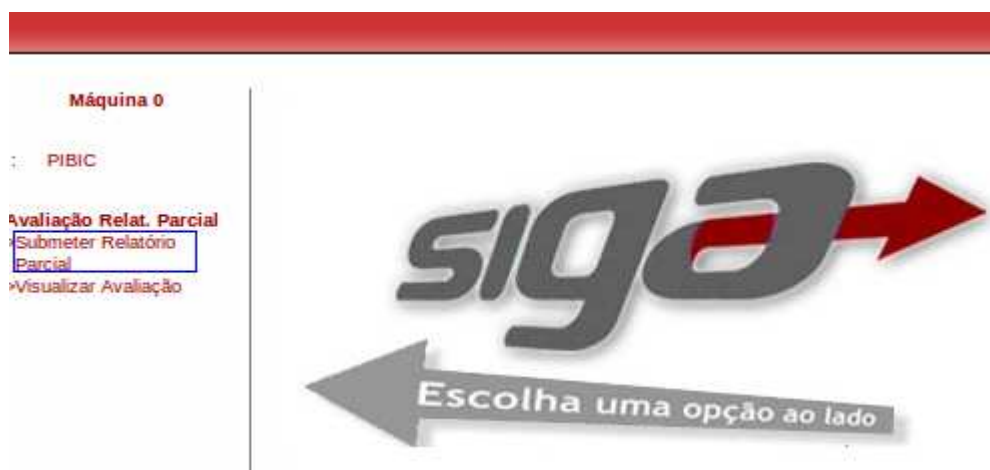
Figura 4 – Link Submeter Relatório Parcial.

O acesso à transação é feito através do link Submeter Relatório Parcial.